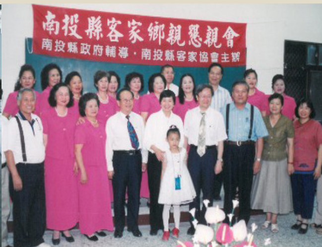
南投縣客家鄉親懇親會（前排左四）