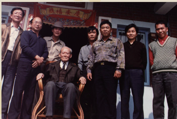
二林鎮耆老與地方鄉賢協助採訪詔安客（左三）