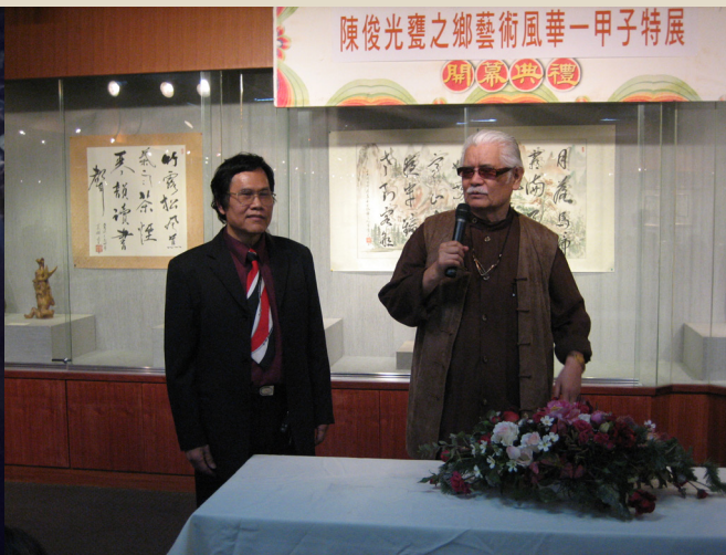
民國 95 年藝術個展李奇茂大師（右）致詞