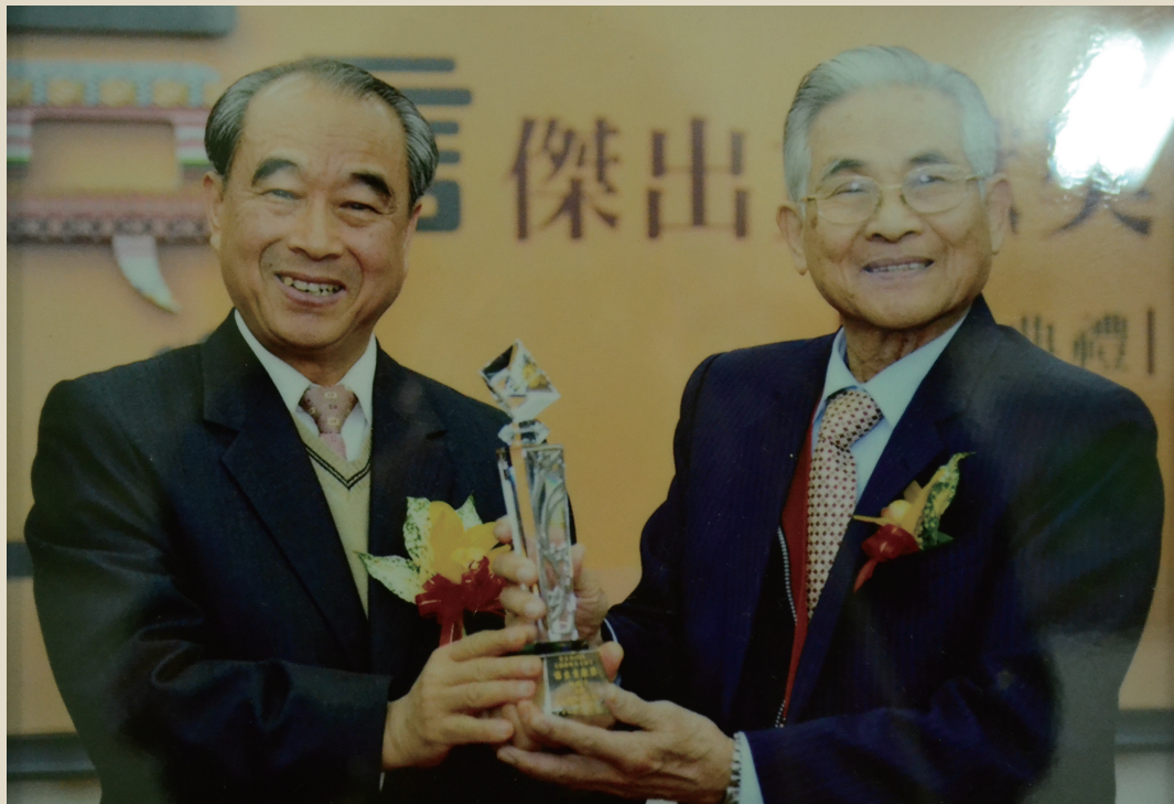
獲頒 103 年度表揚推展本土語言傑出貢獻獎 (右)