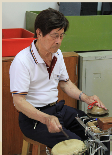
示範客家八音敲仔