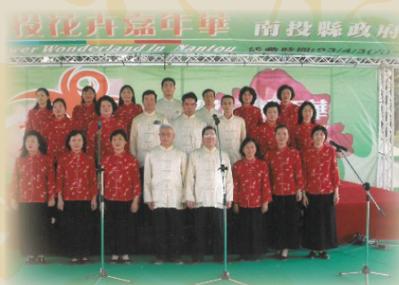
南投縣花卉嘉年華演出（擔任伴奏）

對於下一代的客語傳承，南投縣客家協會也曾和社區發展協會共同辦理客家兒童詩詞吟唱教學班，教授弟子規、四書五經等，讓小朋友在桐花祭或慶典活動中表演，獲得很大的肯定。