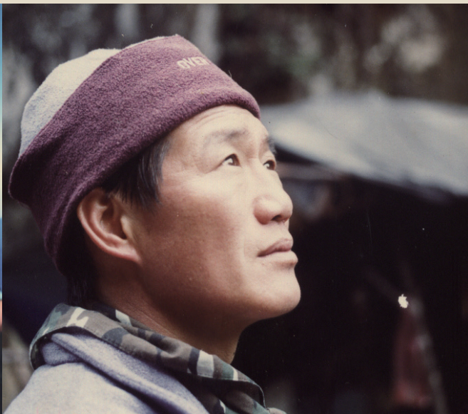
只為與珠峰見一面 舉債度日，割捨感情，辭去工作，密集訓練