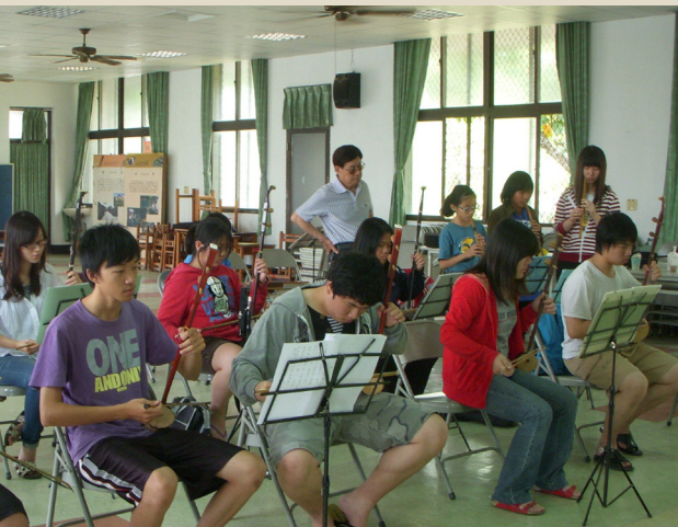
指導福安社區學習客家八音

敲仔（梆子）一起一落，嗩吶樂音的高低起伏，似乎召喚著各路神明，從天而降，祥雲朵朵，緊跟在後的二弦、鑼鼓，正訴說著玄妙的傳奇故事。老樂師們與客家八音共同演奏著生命的曲調，譜出天地之間的秩序與和諧，也讓八音的音符在孩子們的身上發芽，繼續傳承下去。