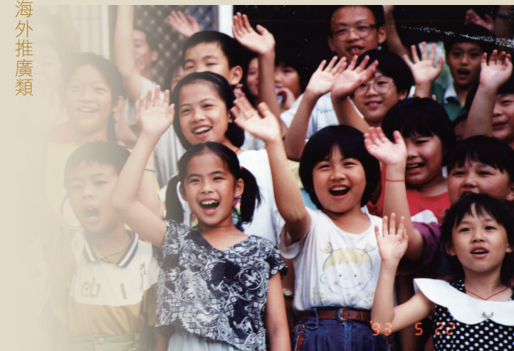
臺視「鄉親鄉情」片頭畫面「大家好」

「1989.1.TTV開播《鄉親鄉情》第一集：客語淪亡前的奮戰；1993.1.6《鄉親鄉情》6點見，孰可忍，孰不可忍！1996回歸自然原始的風貌以Video Camera作為第一手語言的紀錄，《鄉親鄉情》十年半載夢，心中有愛，無怨無悔。」～～張致遠手稿