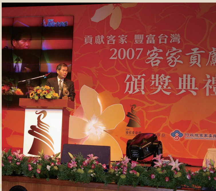
民國 96 年獲頒客家貢獻獎