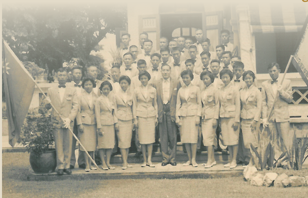
民國 49 年於國立藝專赴泰國宣慰僑胞與駐泰國大使杭立武先生合影（前排右一）