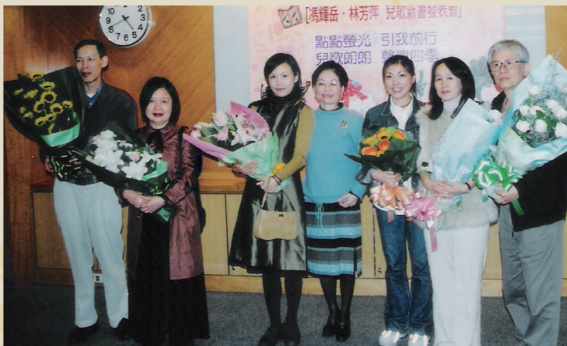
民國93年兒歌新書發表(左一)