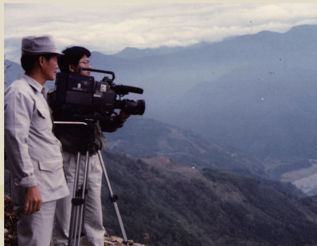
今日寶島有好山好水任我們記錄（左）