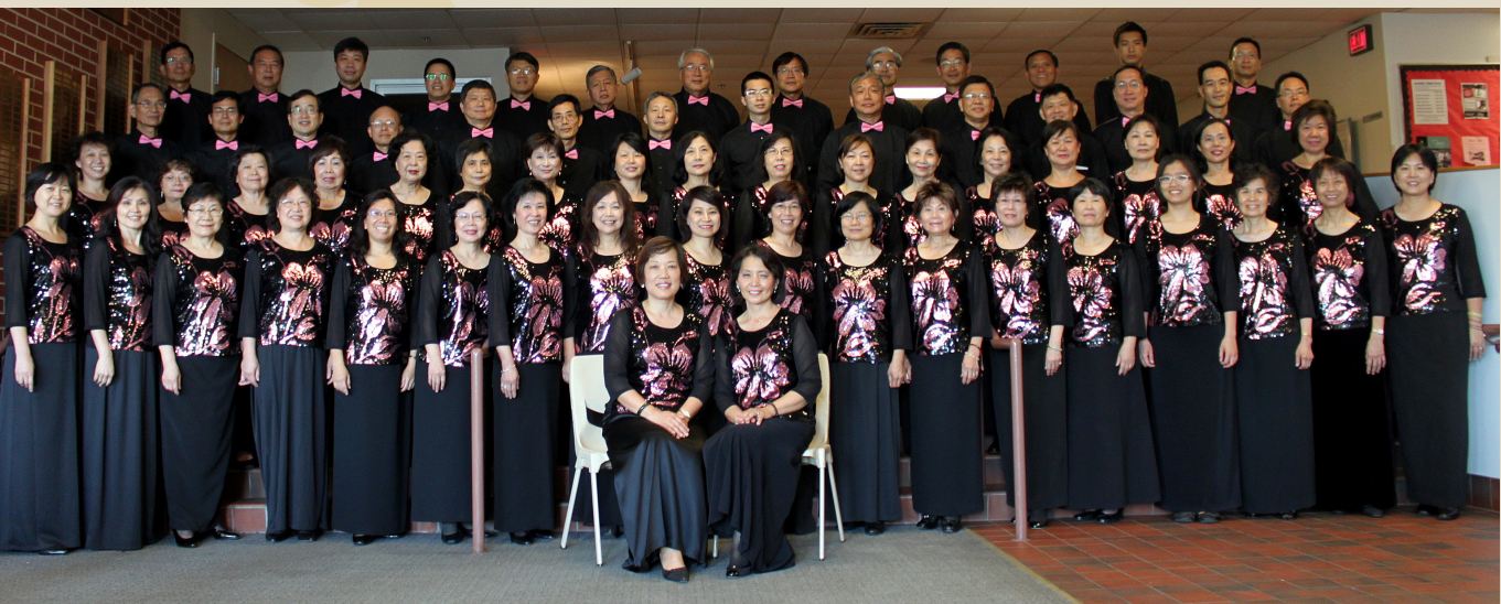
芝加哥客家山歌隊全體合影留念(前排左六)