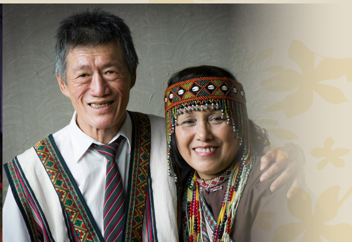
一個生命經驗豐富且角色多元的文化人（左） 夫妻同為原住民付出青春和熱情無怨無悔