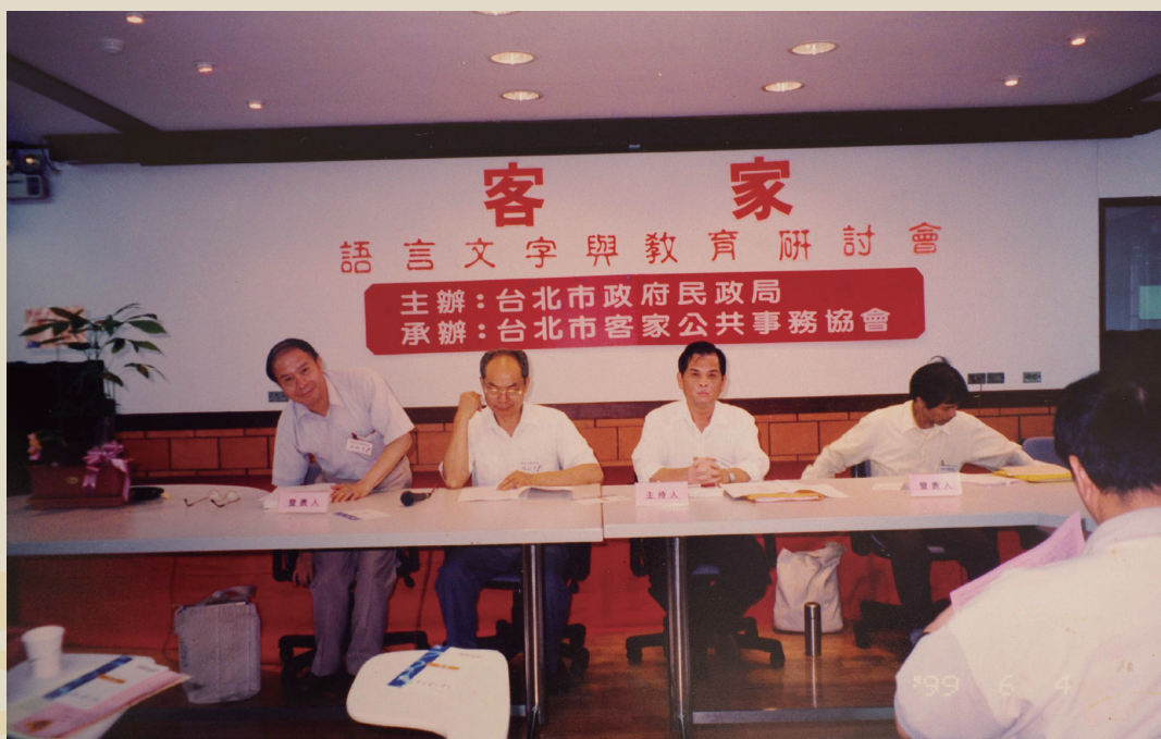
民國 88 年主持臺北市客家語言文字與教育研討會（右二）

1980 年代，在臺北都會區，跟客家有關的平面媒體只有客家雜誌 註 ，開啟了客家事務公共論壇的先鋒，民國 77 年 12 月 28 日，客家人走上臺北街頭，發起「還我母語」大遊行，要求政府修改廣電法對方言的限制，全面