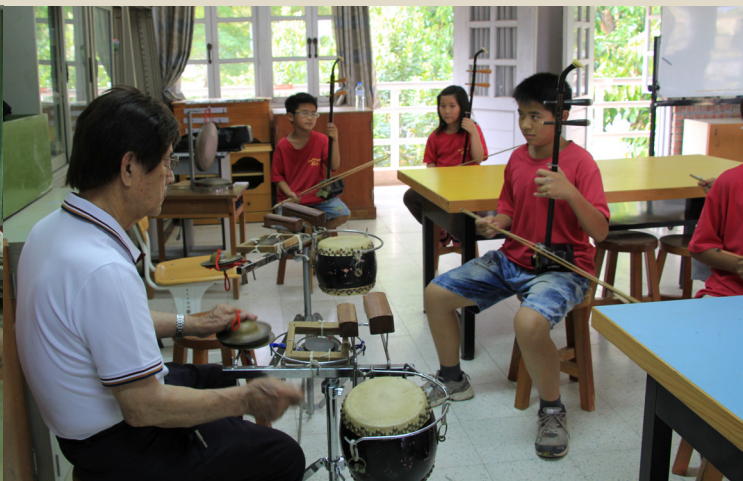
指導福安國小學習客家八音