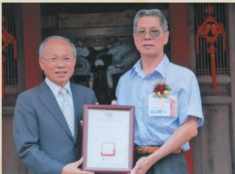
臺灣省主席林政則（左）頒發書院優良教師獎牌