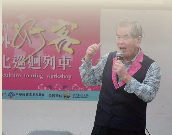
民國 103 年客委會海外好客文化巡迴列車 - 紐約

午後，隆隆滾的雷聲，在灰濛濛的天邊躁動不安，直到雨落，野花小草終於能放肆地迎接久旱的甘霖。在雨聲中來到古國順的家中，一字排開的古文書籍，《集韻》、《廣韻》、《康熙字典》、《光緒嘉應州志》方言篇……，像極了端正危坐的老學究，滿肚子的墨水，默默地等待有心人來推敲、斟酌。