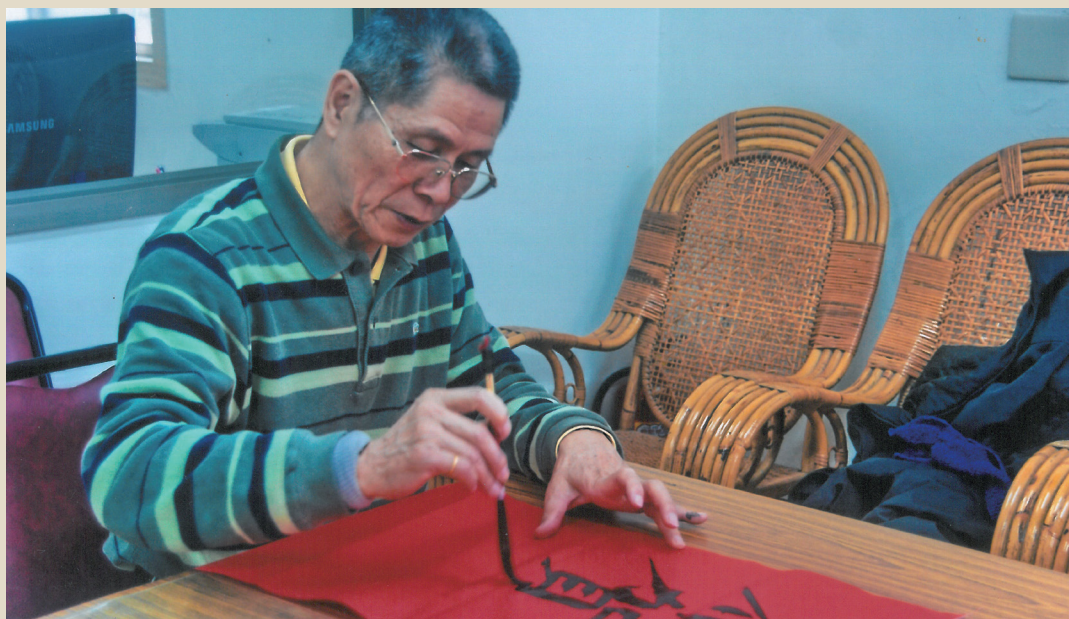
農曆春節前為地方居民書寫春聯

沿著台 13 線，經過頭份尖山、造橋、頭屋，蜿蜒來到苗栗市，也就是俗稱的北苗，尚未抽穗的水稻，是一片蓊鬱的綠，幾隻阿啾箭嘎嘎地啄來追去，迴盪在安靜的巷弄內，挑著菜擔的婦人家詢問著：「愛買菜無？」，初夏的熱氣襲來，一家走過一家，背囊已濕，未料，徐清明家的進門處掛著「大悲咒」，底下的客語音標彷彿是另一種上達天聽的文字，梳洗了語言，定了心。