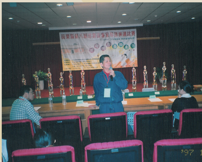
客語演講比賽完畢後講評 (站立者)