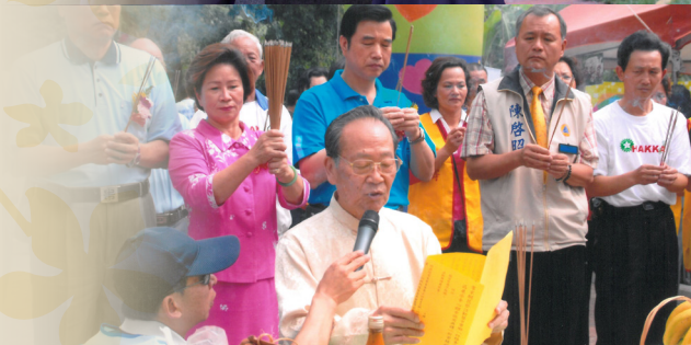
南投縣中寮鄉桐花祭祭天恭讀祭文

對於公共事務，他更是首當其衝，像是在法務部南投看守所擔任教誨師，輔導受刑人時，他不是教條式的授課，而是透過說故事，讓受刑人不要讓自己的母親傷心、失望；擔任苗栗縣後備軍人輔導中心主任時，成立了苗栗縣音樂協進會，他是首任理事長。