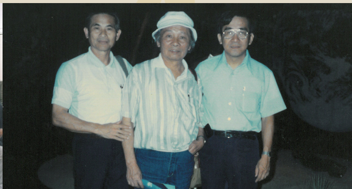
應旅美客家文化基金會赴美演講（左）