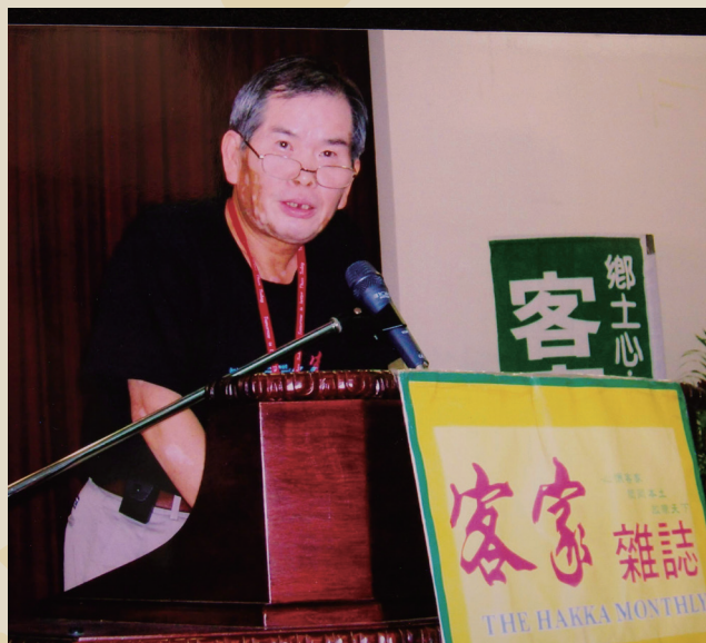
擔任第 17 屆客家夏令營講師及營長