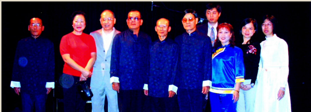
瑞士日內瓦臺灣藝術節展演後合影（前排右四）