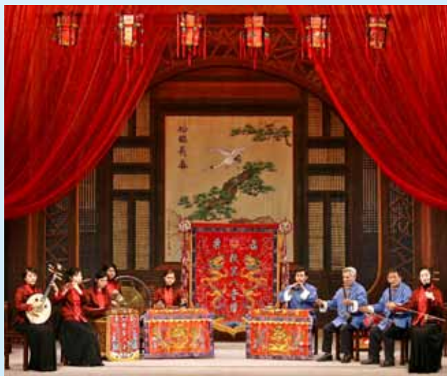
新年特別節目「八音賀歲」錄影演出