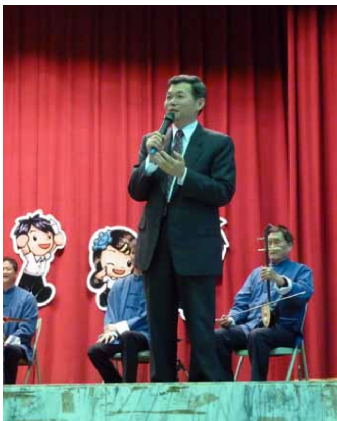
客家八音校園推廣講座演講