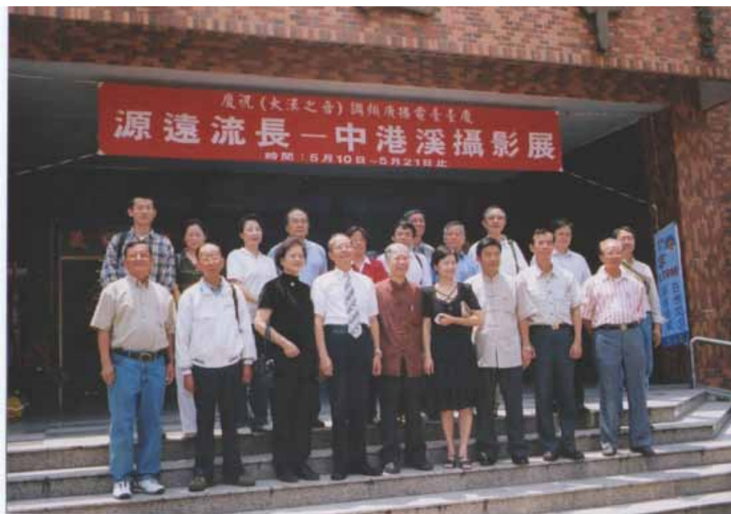
中港溪攝影展與硬頸攝影群等人留影