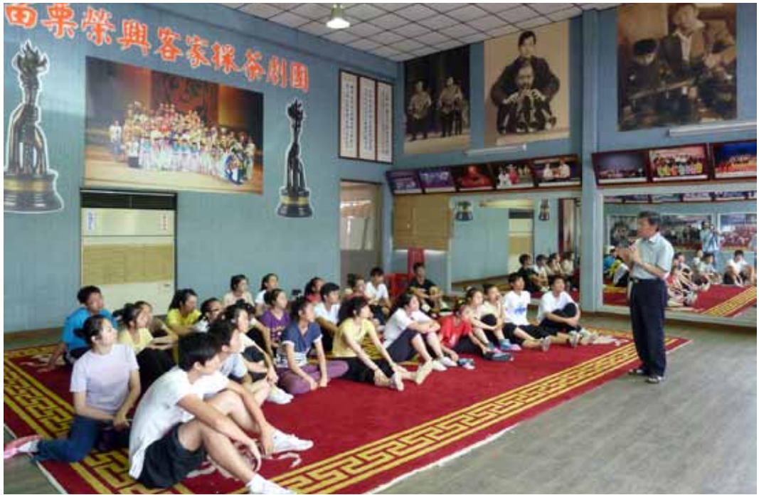
客家戲曲人才培育上課情形