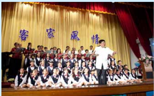
指揮東門國小及桃園愛樂合唱團同台演出