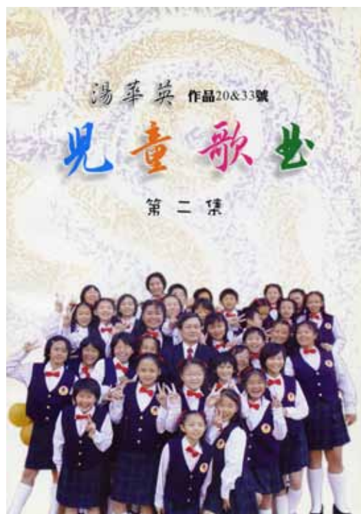
湯華英作品第 20&33 號