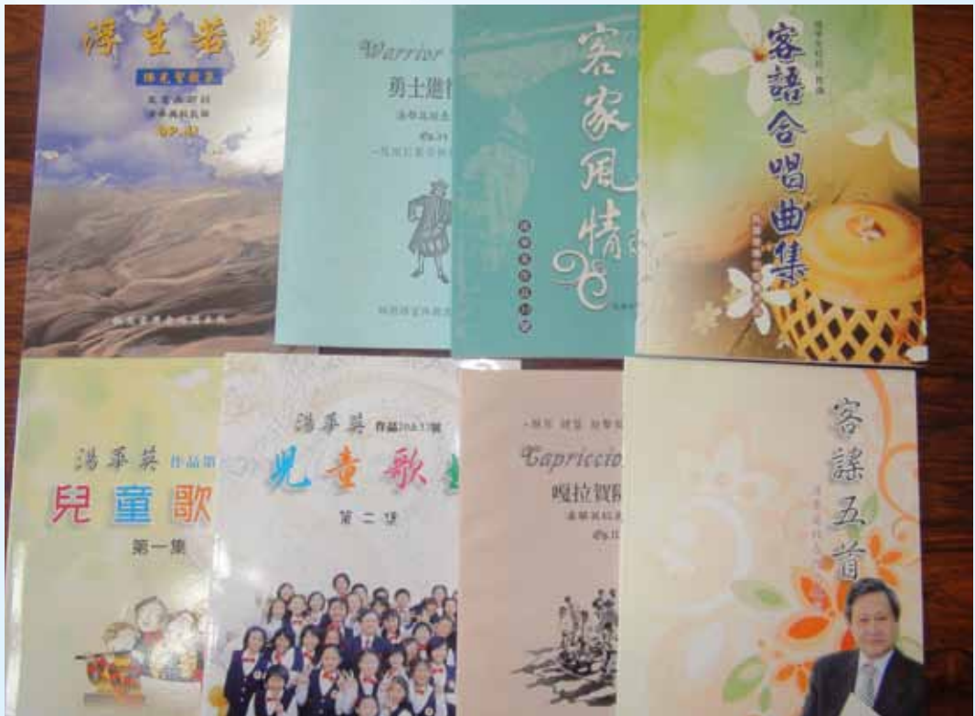
湯華英校長歷年出版作品一覽