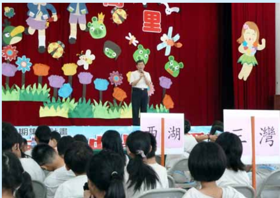
「客戲一夏」客家戲曲暑假研習營開訓