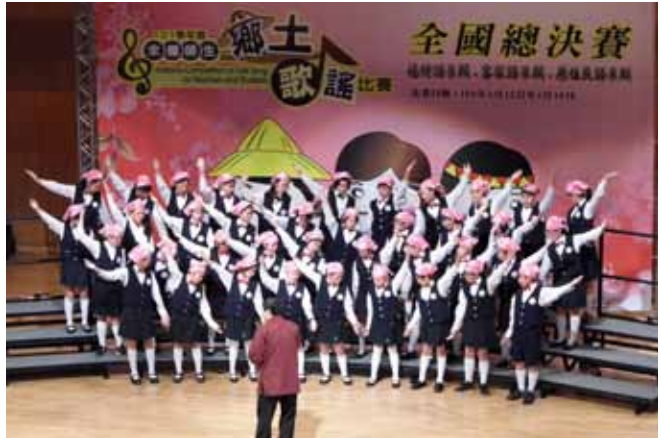
指揮東門國小學生鄉土歌曲客語組合唱比賽全國決賽優等

他 曾指導東門國小、南興國小參加客語生活學校歌唱表演，演唱他的客謠組曲，成績斐然。擔任南興國小校長期間，訓練學生組織合唱團，利用合唱推動客家歌曲，讓學生充分了解客家歌曲之美，並參加鄉土歌曲比賽連續2年獲優等，民國99年更獲得臺灣區第六名，亦因此出版合唱團CD。CD中收錄的是湯華英於民國97年所創作的〈毛蟹〉、〈羊咩咩〉、〈油菜花〉、〈阿丑伯〉、〈細貓仔〉5首客謠歌曲，透過歌曲與歌詞完美的結合，能讓小孩子透過歌唱輕鬆學到客家話。湯華英說；「學校合唱團的小朋友也有許多是不會講客家話的閩南人，但他們唱客語歌唱了1遍、2遍、3遍，久了自然也會客語了，他們可以從音樂中，透過歌詞去學到客家話。」