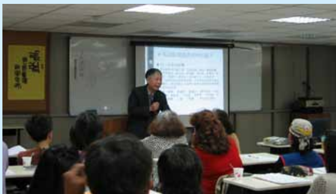
傳授客家廣播新聞實務