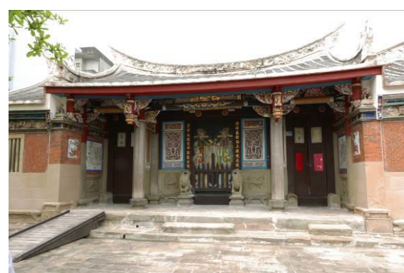
新埔宗祠博物館聯營計畫核心館舍-陳氏宗祠