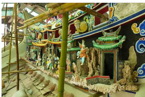
北埔姜氏家廟剪黏修復

「六堆客家文化信仰中心整體風貌改善計畫」、「花蓮市好客文化會館工程」及「臺東客家學堂修繕計畫」等文化資產維護及聚落保存案計56件，藉由古蹟的修繕與閒置空間再利用，認識文化資產的新價值，充實在地之文化設施，創造新的資產活力，並結合地方團體力量發展地方特色，利用現有豐富的環境發展在地地方特色，塑造獨特的人文風情。