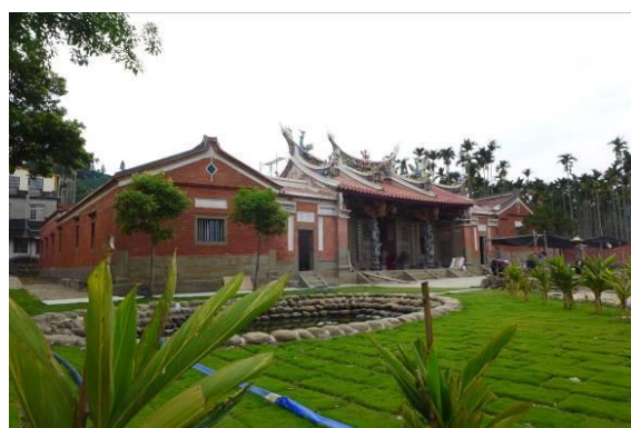
姜氏家廟修復後全貌