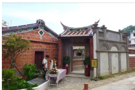
北埔忠恕堂照壁為一大特色