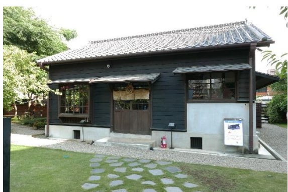
關西分駐所所長宿舍