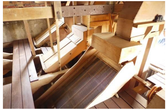
舊穀倉內木製碾米機修復