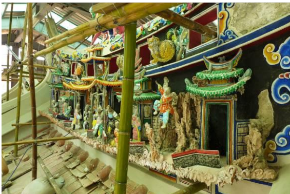
北埔姜氏家廟剪黏修復