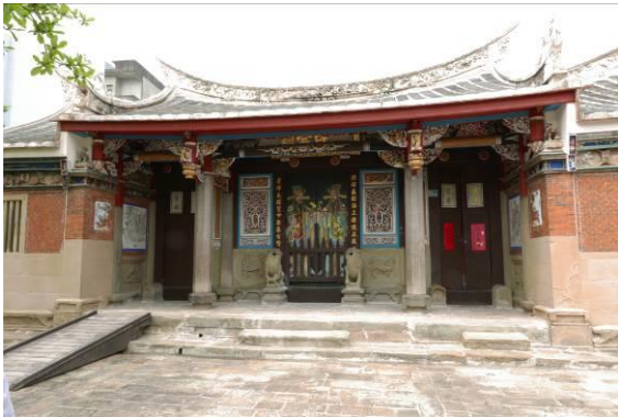
新埔宗祠博物館聯營計畫核心館舍-陳氏宗祠