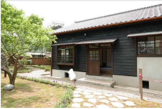
關西分駐所建築群修復後將成為臺三線上重要的文化節點，圖為首棟完成修復之所長宿舍