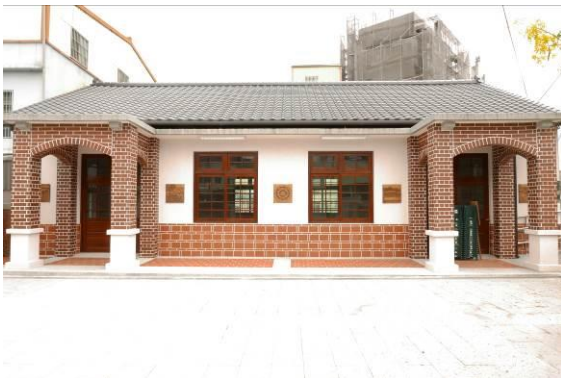
公館鄉舊中山堂修復再利用 過去為鄉立托兒所所在地