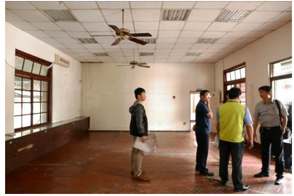
關西分駐所辦公廳舍已遷出，原空間將規劃作為文化推廣用途