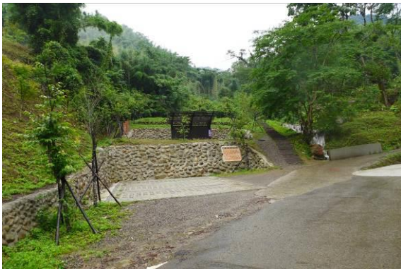
獅潭鹽水坑為特殊地質景觀

103至106年度止，業已辦理「桃園市平鎮區重拾安平鎮庄客家生活美好時光—綠水溪客家生態陂圳生活空間營造工程」、「新竹縣峨眉鄉懷舊生活公園規劃設計暨工程案」、「苗栗縣南庄鄉獅山村竹林古道周邊環境改善規劃設計暨工程案」、「鍾理和文學散步道規劃設計暨工程案」、「吉安鄉南浦客家溯源計畫—海唇情深—客庄」等客家生活環境空間活化再利用案計143件，藉由公共生活空間改造，重新發掘在地歷史及生活故事，利用豐富的人文資源發展在地特色，塑造獨特的客庄人文風情。