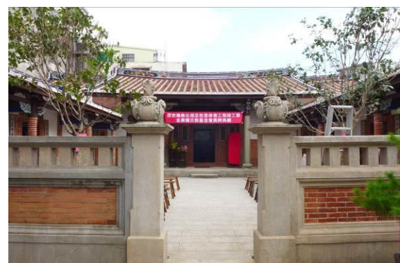
北埔忠恕堂修復後全貌