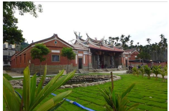
姜氏家廟修復後全貌