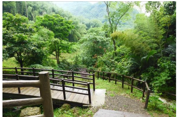
獅潭鹽水坑有優質自然風貌