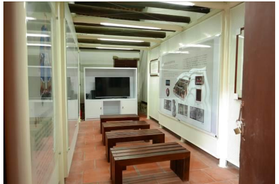
陳氏宗祠內部展示空間