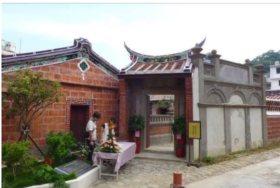
北埔忠恕堂照壁為一大特色