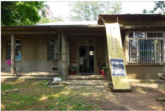
楊梅故事館梅中故事展