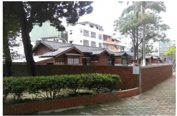
鍾肇政文學生活園區外觀