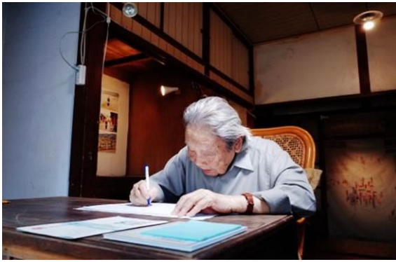
龍潭國小宿舍復原鍾肇政老師昔日寫作場景