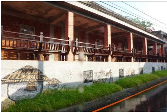
獅潭鄉新店村舊穀倉修復再利用

103年至106年止，業已辦理「關東客家主題市場改造計畫」、「獅潭鄉新店村舊穀倉文化空間再生計畫」、「美濃菸葉輔導站修復工程計畫」及「吉安買菸場-花蓮縣菸葉故事館環境整修工程」等計32件閒置空間再利用工程，作為社區近用、生活記憶保存及社區微旅行服務節點等特色機能性空間。