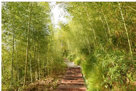
南庄獅山村竹林古道為過去居民往返獅山村 及田美村路徑