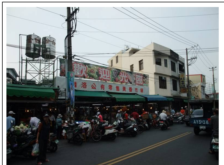
【圖 2-1】麟洛公有零售果菜市場